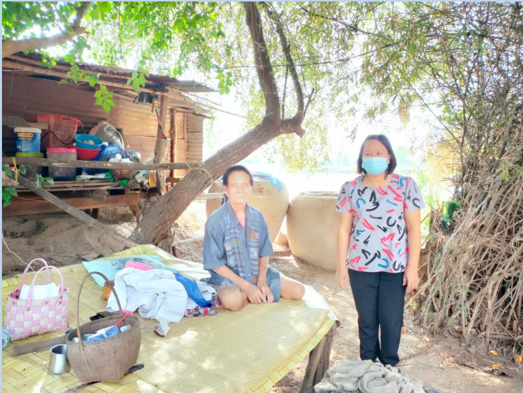
กองสวัสดิการสังคม องค์การบริหารส่วนตำบลหายโตก ลงพื้นที่เยี่ยมบ้าน