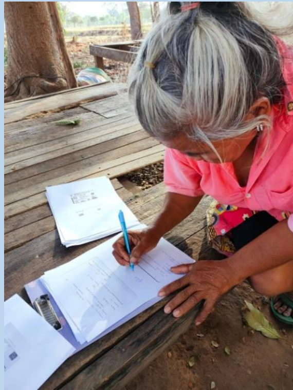
กองสวัสดิการสังคม องค์การบริหารส่วนตำบลหายโศก ลงพื้นที่เยี่ยมบ้าน