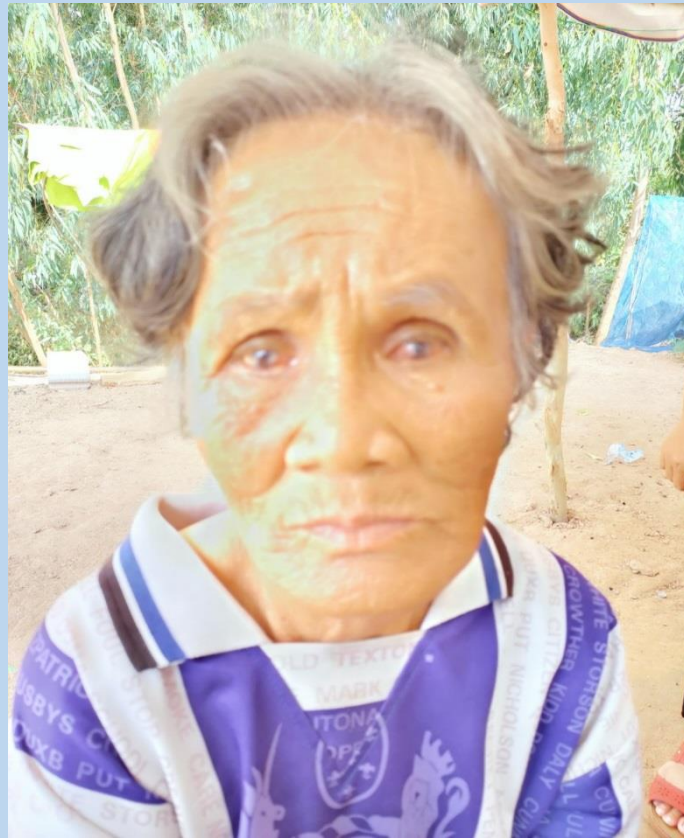
กองสวัสดิการสังคม องค์การบริหารส่วนตำบลหายโศก ลงพื้นที่เยี่ยมบ้าน