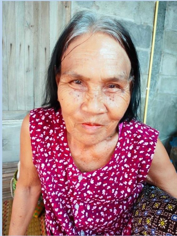
กองสวัสดิการสังคม องค์การบริหารส่วนตำบลหายโศก ลงพื้นที่เยี่ยมบ้าน